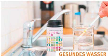
GESUNDES WASSER SANIERUNG